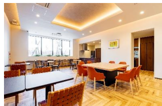
カフェダイニング

●初期費用 59.9~68.4 万円 ●月額費用 22.7~26.7 万円 家賃、共益費、サービス支援費含む